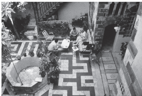
噴水を置き緑を育て、「地上の楽園」の雰囲気を感じさせるダマスカスの住宅の中庭

定価 2100円+税 【7月下旬刊行予定】 46判・並製・312頁 ISBN 978-4-910036-07-6C0052