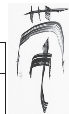
帯文字 100 体