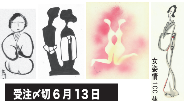
女姿情 100 体

笹島寿美 心象幻画集 Sumi Sasajima 帯・着物からみた女の姿情と曲線