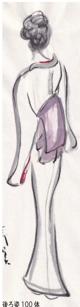
後ろ姿 100 体