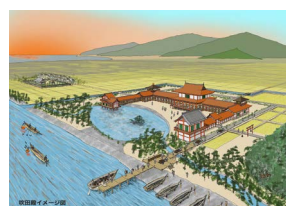
吹田殿イメージ図