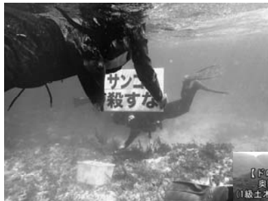
強行される辺野古埋め立て海域のサンゴ移植作業を海中で監視し、「サンゴを殺すな」と訴えるカヌーチームのメンバー