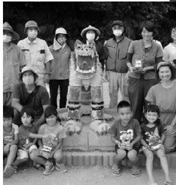
首里城の破損瓦を利用した「平和を守る」まぶいぐみ瓦シーサー