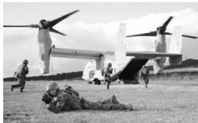
陸自水陸機動団と米海兵隊の共同演習