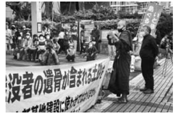
遺骨混じりの土砂採取に反対する「ガマフヤー」のハンスト集会に集まった沖縄県民

A 5判ソフトカバー292頁 本体 2,000円 ISBN978-4-8295-0824-4