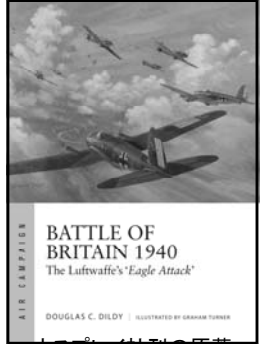
オスプレイ社刊の原著

1940年8月～9月、イギリス本土上空とドーバー海峡で展開されたドイツとイギリスの戦い「バトル・オブ・ブリテン」は第二次世界大戦の結果に大きな影響を与えた