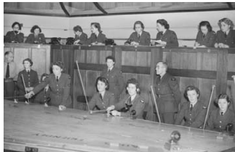
イギリス空軍の第11飛行群司令部の作戦所で勤務する女性兵士