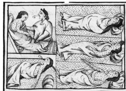
16世紀のメキシコの天然痘感染者