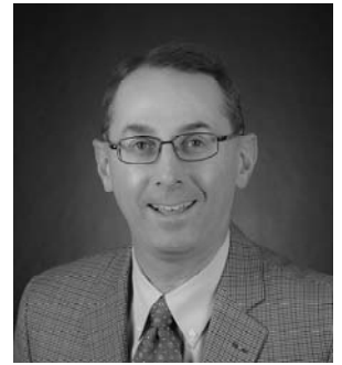
ジェームズ・ホームズ

四六判ソフトカバー268頁 本体 2,500円 ISBN978-4-8295-0797-1