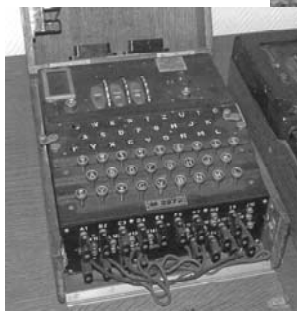
暗号発信器エニグマ