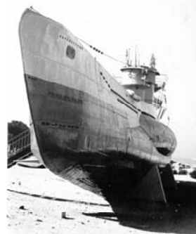
現在もキール軍港近くに展示されているU995

A 5判ソフトカバー180頁 本体 2,300円 ISBN978-4-8295-0799-5