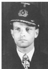
Uボートのエース リュート艦長