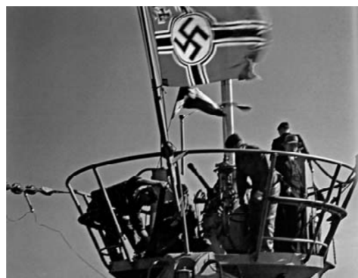
艦橋に掲げられたドイツ軍艦旗