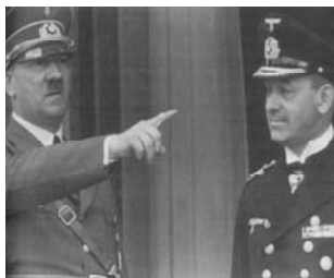
ヒトラーとレーダー元帥