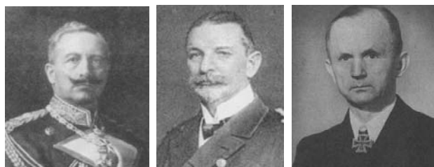
ウィルヘルム2世 ティルピッツ海相 デーニッツ元帥