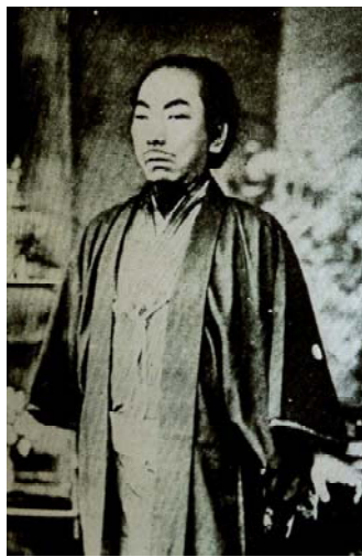
琉球国王最後の国王尚泰