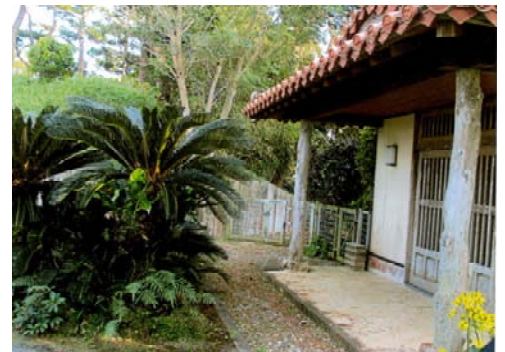
昔の面影を伝える 伊江別邸