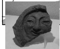
人面瓦「微笑む新羅人」(新羅を輝かせた博物館)