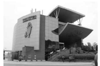
長生浦クジラ博物館