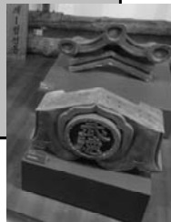
日本の植民地時代の建物に使われた瓦(東亜大学博物館)