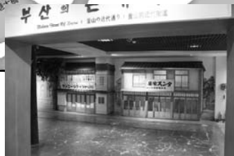
復元された商店街(釜山近代歴史館)