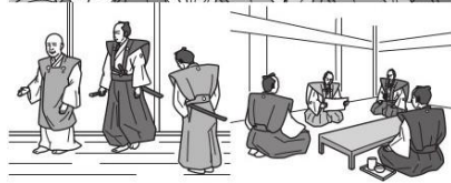
上記図案は内容見本の一部です。

今回も軽妙な文章とイラストでその驚愕の事実を明らかにしています。また、監修は前回に引き続きNHK大河ドラマ等でおなじみの小和田哲男先生。より濃く確かな内容に仕上がっております。