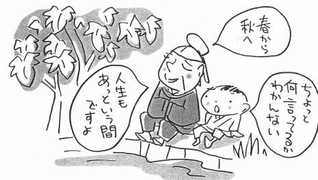
「少年老い易く(偶成)」より