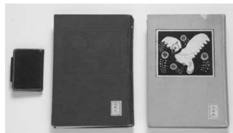
水野直日記、懐中手帳

旧貴族院の会派「研究会」所属議員により1928年に設立された公益事業団体。学術研究助成、日本近代史関係資料の調査・研究に取り組んでいる。その成果は、『品川弥二郎関係文書』『山県有朋関係文書』『三島弥太郎関係文書』『阪谷芳郎東京市長日記』『田健治郎日記』などの資料集として叢書40冊、ブックレット出版31冊が出版されている。