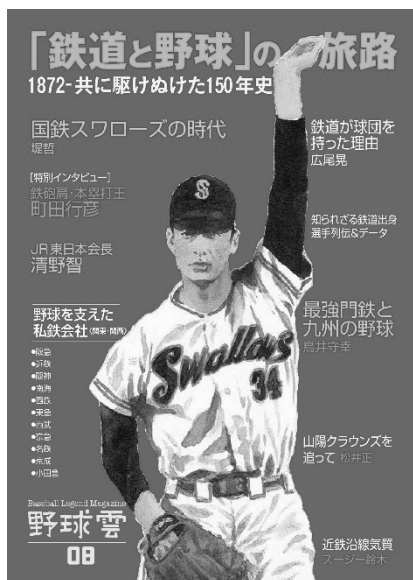
(表紙イラスト) 金田正一