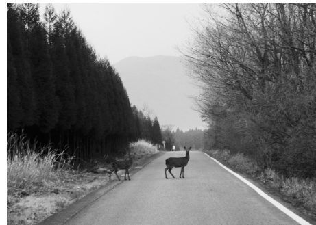
写真左より：雪の飯田高原。ハルリンドウ。男池へと向かう道で何度も遭遇する鹿。下：南小国町・押戸石の丘より、朝日に輝く草原。