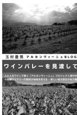
玉村豊男 アルカンヴィーニュBLOG ワインバレーを見渡して 人とワインで繋ぐ「アルカンヴィーニュ」プロジェクト進行中 小規模ワイナリーの集落が地域を変える一冊！地方創生の処方箋 ●定価：1,200円＋税 ●四六判・並製●240P