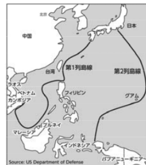
中国の第1及び第2列島線

米中の地政学的な対立と、中国が突きつけている「アクセス阻止・エリア拒否」(A2/A D) 戦略の脅威を明らかにし、後手に回っている米国の対応や、将来米国が行う可能性のある行動について具体的に言及。米中の軍事面での対峙を鮮やかに描き出しているのが本書の特徴。