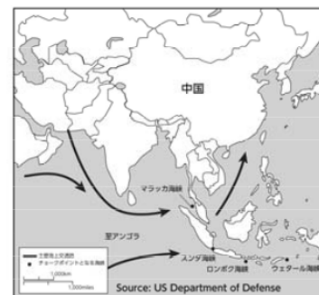
中国のエネルギー輸入ルートと チョークポイントの候補